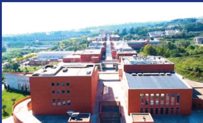
Unical - Via Pietro Bucci - Arcavacata di Rende

In auto: Autostrada A2 Salerno-Reggio Calabria --> Uscita Rende - Cosenza Nord, seguire le indicazioni per Università